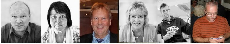
STYRET I NESODDEN BRIDGEKLUBB 2017-2018

Spilling tirsdager kl. 18:15 i kantinen på Nesodden videregående skole