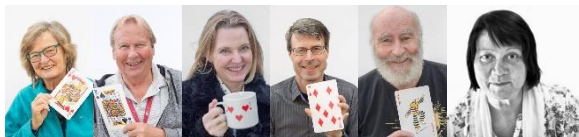
STYRET I NESODDEN BRIDGEKLUBB 2019-2020