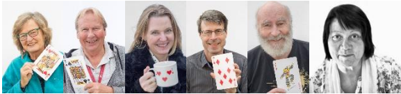
STYRET I NESODDEN BRIDGEKLUBB 2019-2020