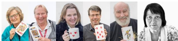
STYRET I NESODDEN BRIDGEKLUBB 2019-2020