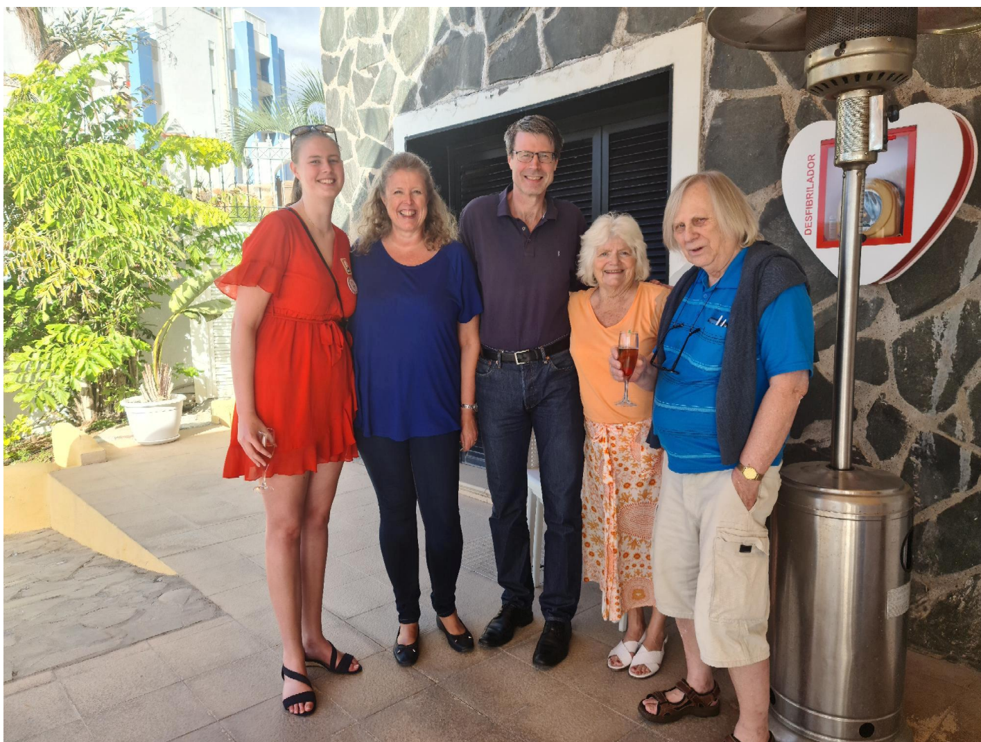
Blide Nesoddenspillere klare til dyst!

Allerede i morgen vil det bli enda flere par, og til neste uke blir det helt fullt med rundt 130 par. For de som vil følge med på resultatene kan de se her: https://www.bridgeforalle.org/Resultater .