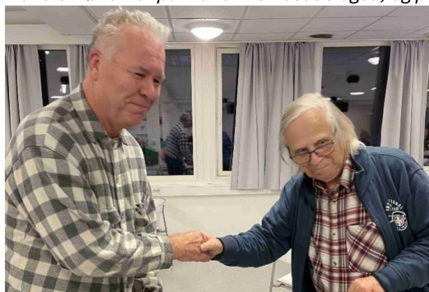
Timmi ble hjertermester, med 50 Mesterpoeng